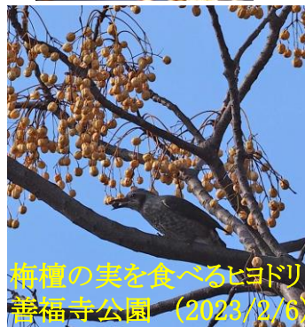
梅枝の実を食べるヒヨドリ 善福寺公園 (2023/2/6)