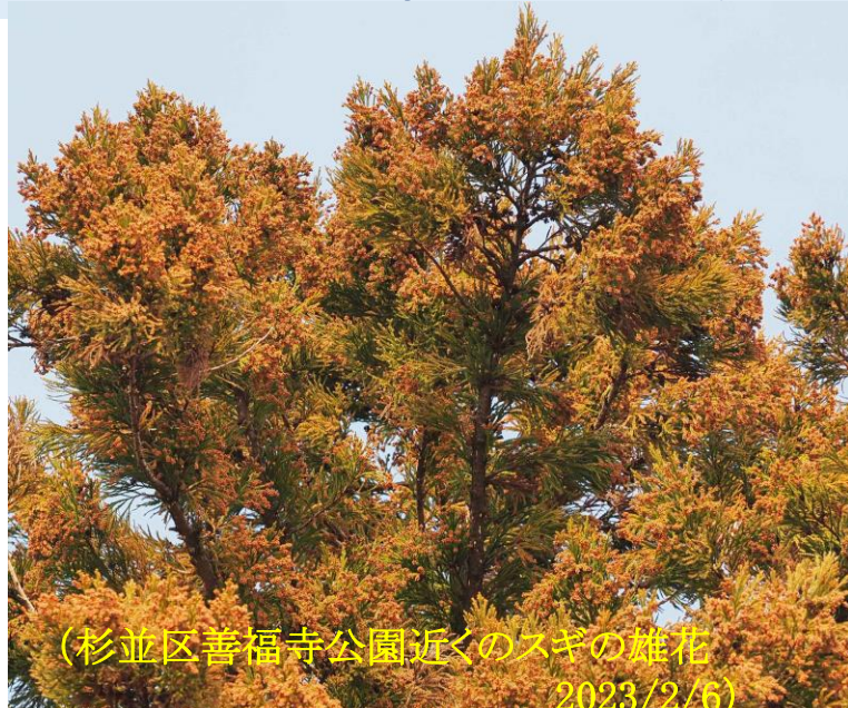
(杉並区善福寺公園近くのスギの雄花 2023/2/6)